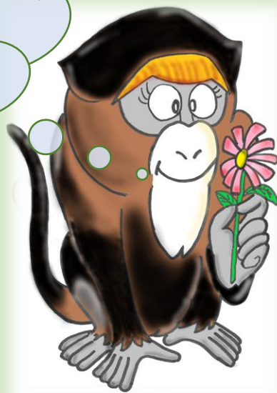
ブラッサグエノン